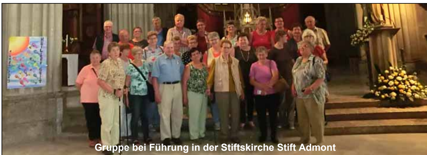
Gruppe bei Führung in der Stiftskirche Stift Admont

1. Tag: Stiftbesichtigung und Mittagessen im Stift Admont, Übernachtung in Bad Mitterndorf, Hotel Post (N).