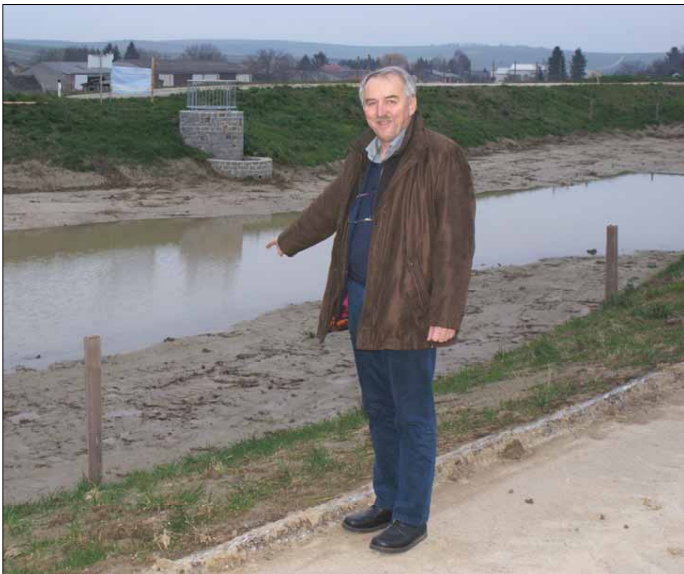
JVP-Bäume bei Rückhaltebecken in Herzogbirbaum