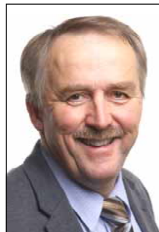
Bürgermeister Karl Lehner

Über den Winter sind noch viele Vorbereitungsarbeiten für den Neubau des Feuerwehrhauses und des Wirtschaftshofes in Großmugl zu erledigen. Geplanter Baustart ist im Frühjahr. Als Bauzeit sind 2 Jahre geplant. Für die Nachnutzung des alten Feuerwehrhauses gibt es konkrete Ideen. Wir haben eine junge inno-