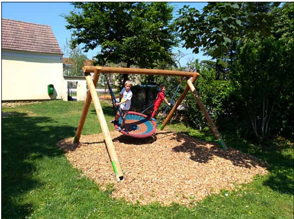
Abnahme durch die Profis