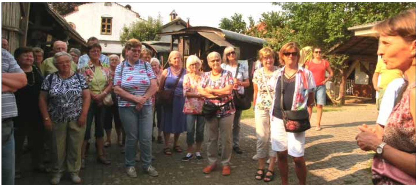
Dorf museum in Mönchhof

Eine schöne Fahrt ins Burgenland, Besichtigung des Dorf museums in Mönchhof, Mittagessen, Schifffahrt in Illmitz und Heurigenabschluss.