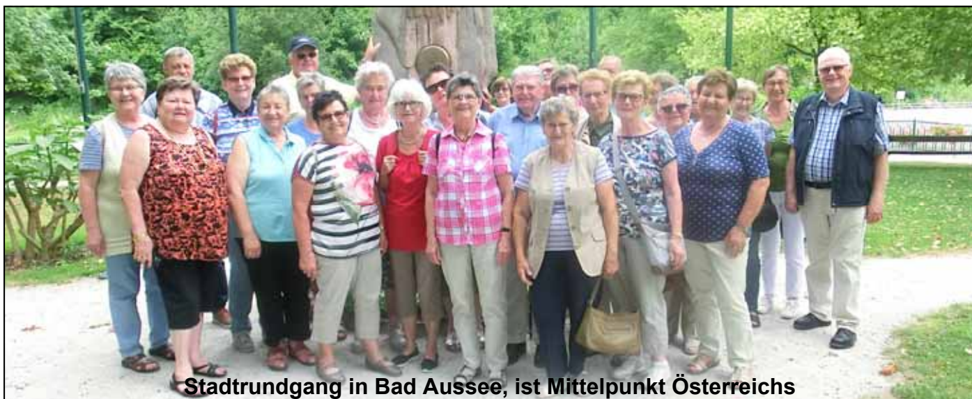
Stadtrundgang in Bad Aussee, ist Mittelpunkt Österreichs

2. Tag: Bad Ischl mit Rundfahrt und Cafe Zauner, Spaziergang in Hallstatt mit diversen Besichtigungen, Bad Aussee, am Grundlsee Mittagessen und Schifffahrt , Bad Mitterndorf (N).