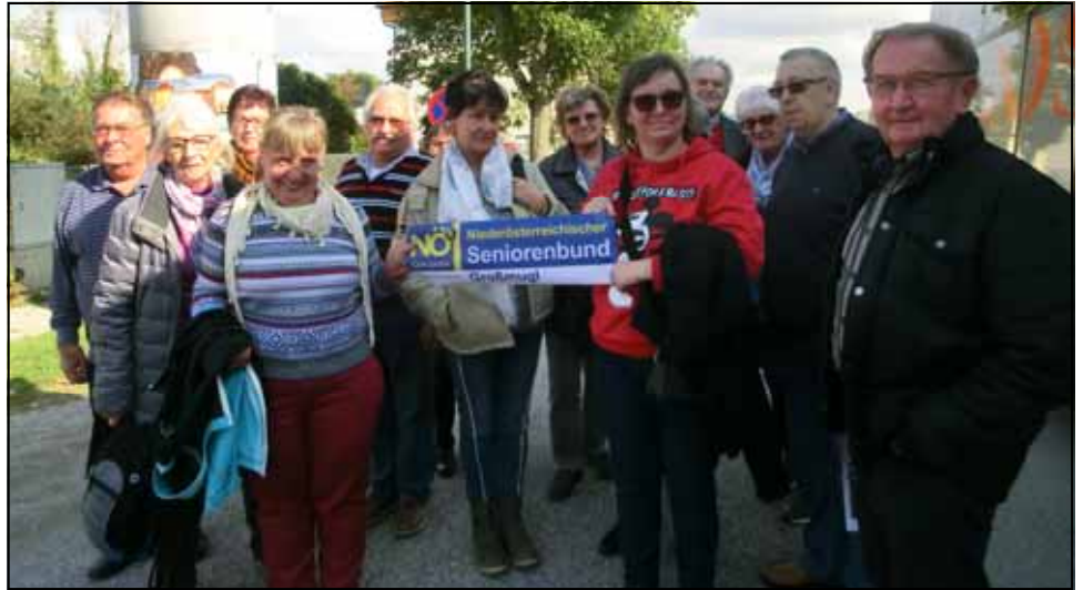
Vor dem Schloss Orth

Es ging nach Bruck/Leitha zur Erzeugung von BIO Knabber- und Schokosnacks „Landgarten“ mit Führung und stark in Anspruch genommener Einkaufsmöglichkeit, ME neben dem Schloss Hof, Weiterfahrt nach Orth/Donau ins Nationalpark-Zentrum. Schloss Orth mit Führung durch das Schlosstheater und durch Teile des Parks. Abschluss beim Heurigen.