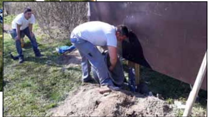
Die fleißigen Eltern beim Aufbau der Kletterwand.