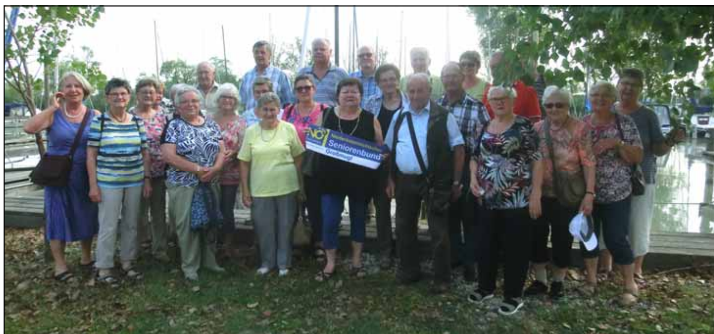
Gruppe nach Schifffahrt in Illmitz am Neusiedlersee