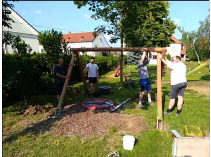
Renovierung der Nestschaukel