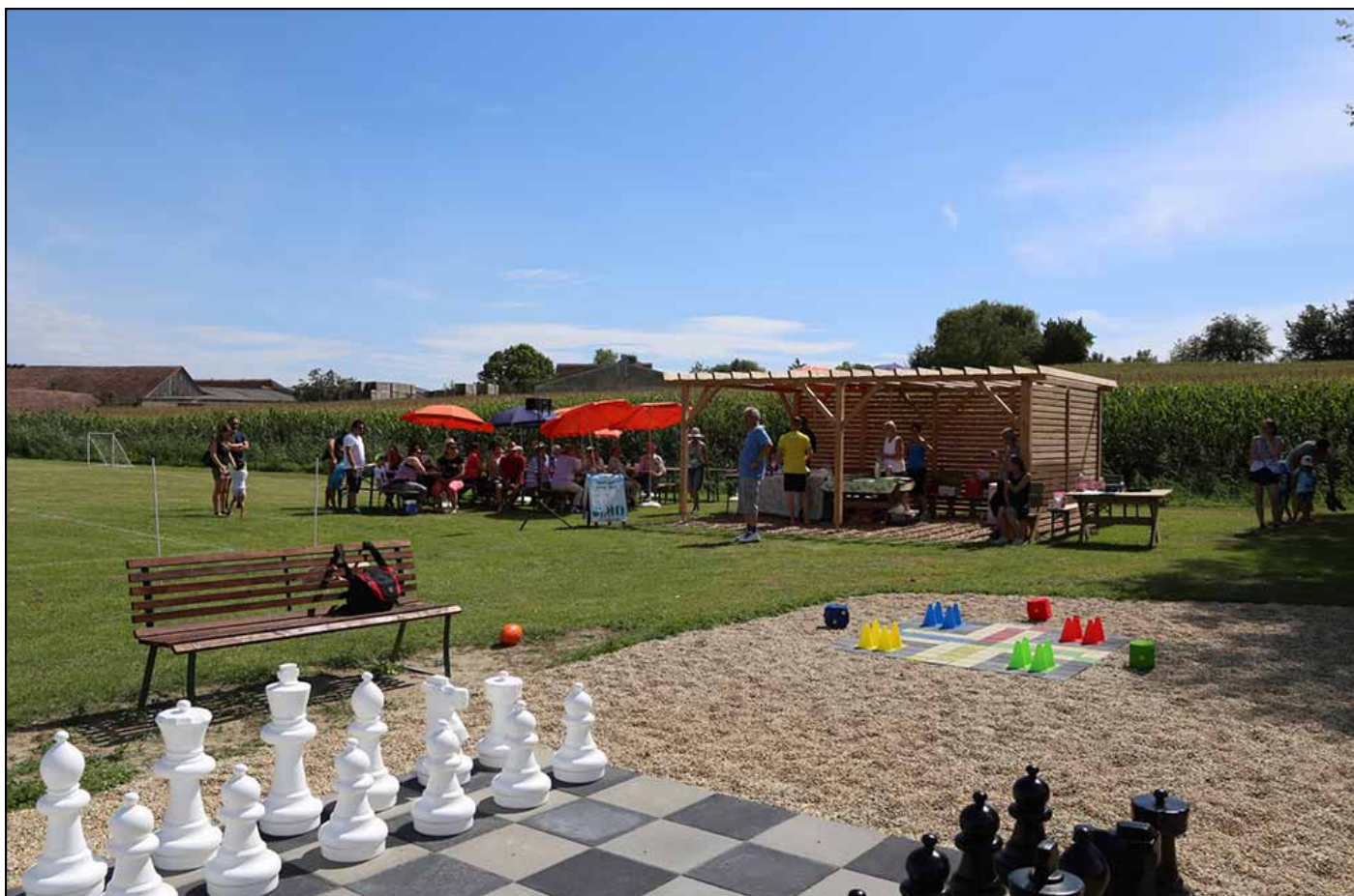
Fest bei schönstem Wetter